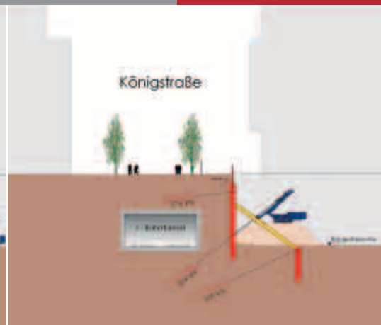
Herstellen der unteren Ankerlage.